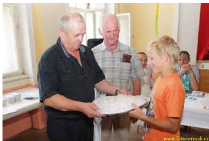
Ze slavnostního shromáždění ke 100 výročí založení spolku včelařů v Jesenném.