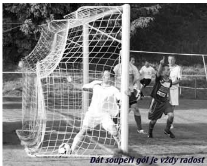
Dát soupeři gól je vždy radost

Potom přišel útlum ve výkonnosti, ale přesto nemáme problém ze záchranou v I. A. třídě KL. pro další