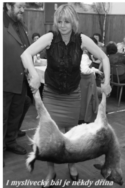
I myslivecký bál je někdy dřina

Chtěli bychom se též zmínit o problému a to pohybu zvěře po obci. V důsledku jednostranné stravy dochází k tomu, že to co jí chybí nachází u našich domovů. Budme k ní tolerantní neboť se může stát, že časem ani tuto zvěř nevidíme. Děkujeme za pochopení. Za všechny myslivce Vám přejeme hezkou dovolenou a hlavně hodně zdraví.