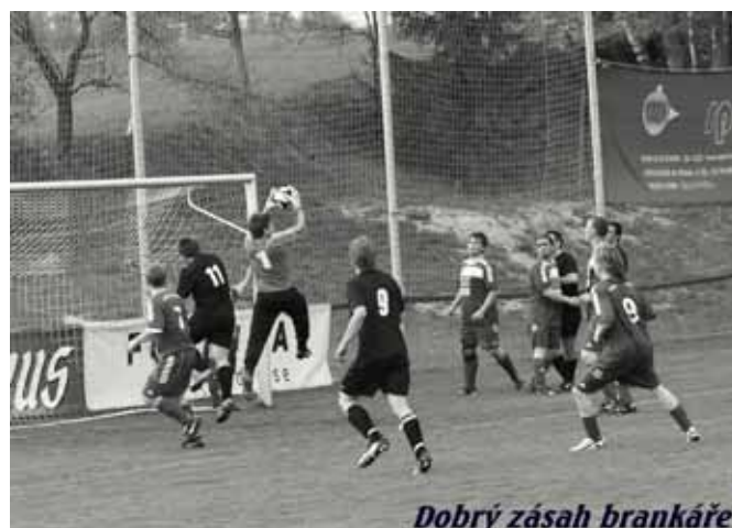
Dobry zásah brankáře