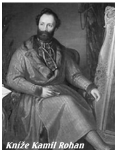
Kníže Kamil Rohan

Před 120 lety - v roce 1892 zemřel poslední feudální