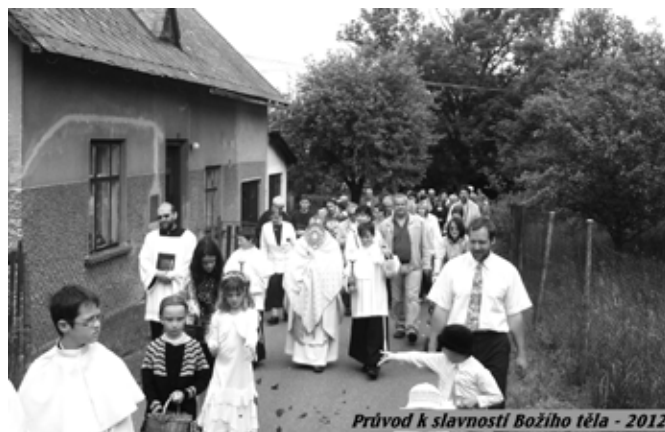
Průvod k slavnosti Božího těla - 2012

Můžeme říci, že toto procesí je vždy znamením svobody a Boží přítomnosti, možná proto vždy v totalitních dobách byl zákaz procesí a veřejného vyznání víry. Kněz u oltáře vždy čte evangelium a žehná obci, domům, práci, všemu co se koná a prosí