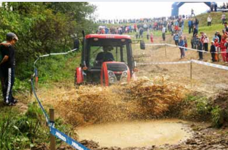
Ze závodů traktorů, traktůrků a dalších samohybnů

tu přivedl do Bozkova trať podniku Mistrovství světa, které se konalo v Semilech.