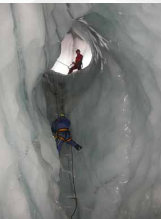
Z ledového podzemí Špicberků

Činnost bozkovské skupiny jeskyňářů, členů České speleologické společnosti, se soustřeďuje především na průzkumné práce v oblasti západních Krkonoš a přilehlého Podkrkonoší. Zde se v poslední době podařily, dá se říci mimořádné objevy v okolí Dolní Rokytnice. Zdejší krápníková jeskyně Netopýří mlýn patří k nejdelším v Krkonoších. Její podzemní jezero láká k dalším průzkumům nejen nás, suchozemské jeskyňáře, ale i jeskynní potápěče.