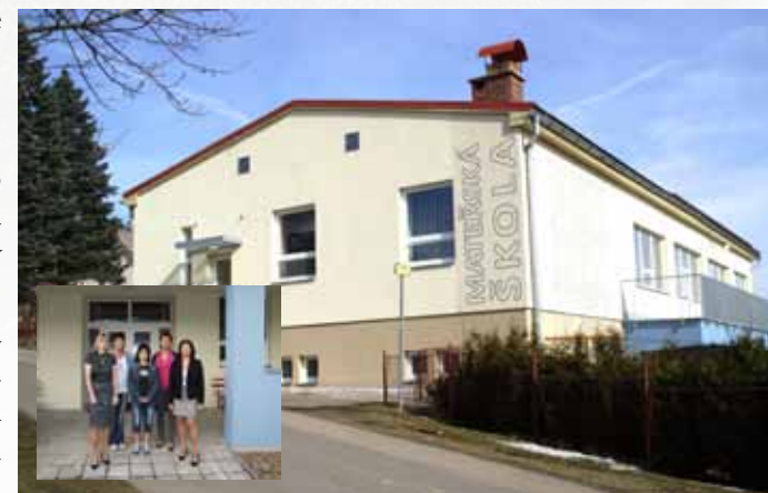
Rekonstruovaná budova mateřské školy a její personál.

V základní škole máme v současnosti zapsáno 22 žáků. Ve dvou třídách je rozděleno 5 ročníků.