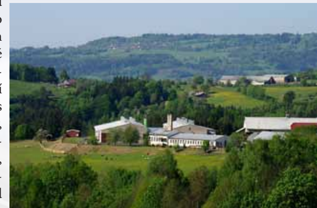
Areál firmy ROKA

Nakonec není tak důležité hledat správná slova a definice, důležité je vždy to, co nás při takových setkání spojuje. Návrat do dětství a mládí, důvěrně známé prostředí, setkávání, která nemusí být jen romanticky nostalgická, ale mohou být i přínosná. Výměna zkušeností, vzájemné vyprávění o vlastních osudech, hledání společných témat, jak svému rodišti