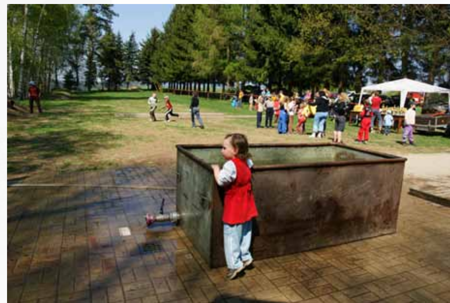
Nově vybudovaný hasičský areál

Vloni na podzim jsme v Bozkově přivítali více než 600 soutěžících a rozhodčích z celého okresu. Okresní sdružení hasičů v Semilech nám světilo pořádání okresního kola hry Plamen. Ani v této, opravdu organizačně náročné akci naši hasiči nezklamali. Zde je na místě vyseknout velké poděkování Míle Václavíkové a partě pomocnic kolem ní, které připravovaly jídlo na tuto soutěž. Na konec neskromně uvedu, že tato soutěž byla velmi kladně hodnocena soutě-