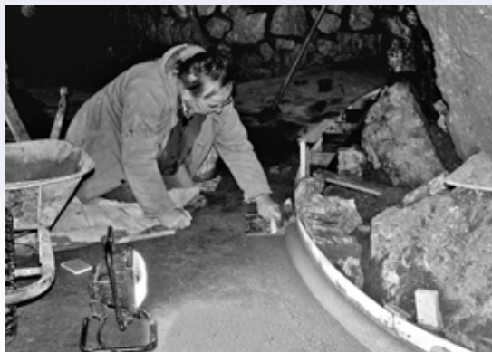
Pěčlivé dokončovací práce na úpravách chodníků

Nejvýznamnější akcí posledních let však byla ekologizace údržby jeskyní. Možná to ani nevíte, ale ve