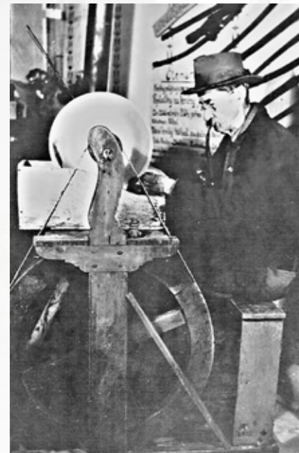
Sekání na klemprdě