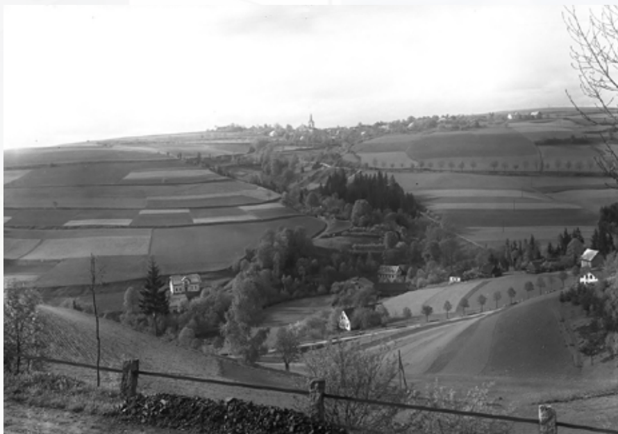
Bozkov na začátku 20 století

V roce 1639 zde Švédové „zle řádili, vše pobrali“. V dřevěném kostele spálili mobiliář a udělali z něho kasárna. Zakrátko dobyli i Návarova a drželi se tam po dva roky. Po jejich vypuzení na císařský rozkaz byl hrad roku 1645 zbaven opevnění a kame-ne použito na stavbu blízkého zámku. To už ale Bozkov od roku 1627 patřil pod Semily.