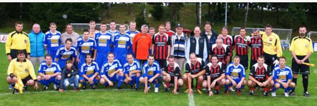
Sokol Bozkov : FC Kozlovna Ládi Vízka

Na druhé straně najdeme dva nové volejbalové kurty. Tradičně se zde pořádá oblíbený turnaj dvojic v nohejbale. Kurty jsou opatřeny