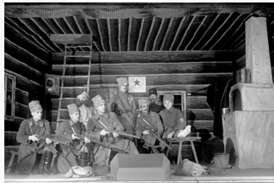
Z představení „Smrt matky Jugovičů“ Bozkovská premiéra v roce 1923 proběhla za účasti delegace jugoslávského velvyslanectví.

Obec byla povýšena na městys a měla svého policajta. Bylo zde loutkové divadlo, v sokolovně se pravidelně hrálo ochotnické divadlo, promítaly se filmy. Ve dvacátých letech bylo uváděno 10 až 12 divadelních her ročně.