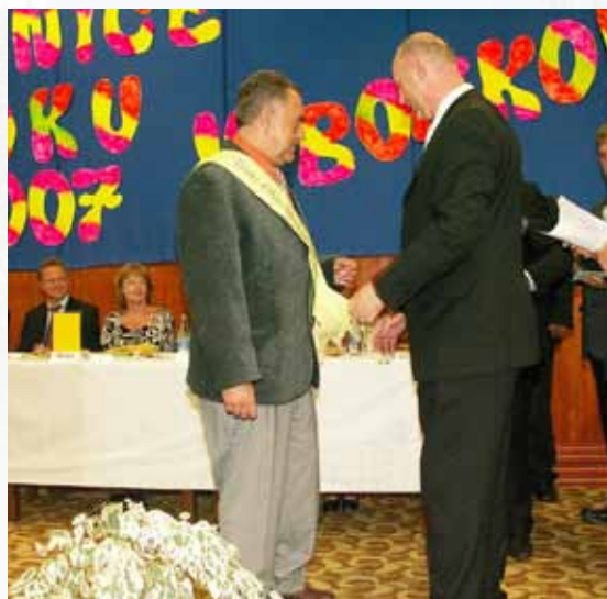
V roce 2007 získala obec titul Vesnice roku Libereckého kraje

V rámci celostátní akce Zelená úsporám se vloni kompletně zateplila školka. Došlo i k výměně oken a změnil se způsob vytápění na tepelné čerpadlo. Na školce již několik let slouží fotovoltaická elektrárna.