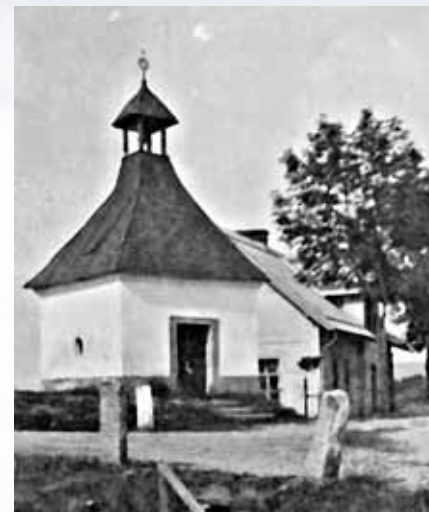
Sejkorská kaplička dříve a dnes

Když jsem se zmínil o Sejkorské kapličce, musím také uvést, že před několika lety dala na ni obec zhotovit