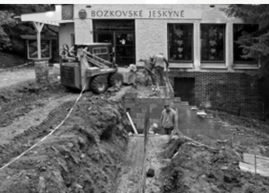
Budování nové opěrné zdi a přístupového chodníku