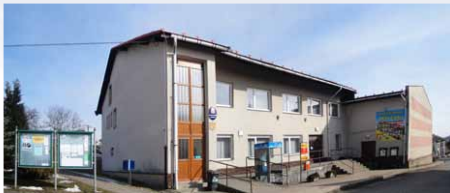
Budovy obecního úřadu a sokolovny

se objevují zájemci o stavbu domku právě v Bozkově.