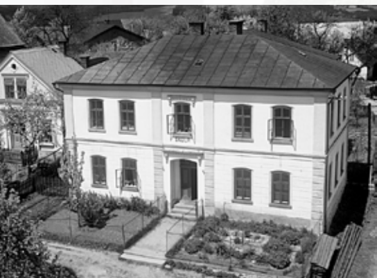
Školní budova pochází z roku 1776

Slavné mariánské poutě se konaly čtyři do roka. To pochopitelně podporovalo také hospodářskou prosperitu.