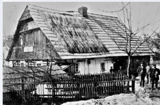
Předchůdce hospody Na Rynku

Je až k neuvěření, že za první republiky bylo v Bozkově 8 hostinců, 3 koloniály, 2 řezníci, 3 pekaři, 3 krejčí, 3 švadleny, 4 ševci, 2 truhláři, 2 kováři atd. (údajně byl v Podbozkově dokonce nevěstinec).