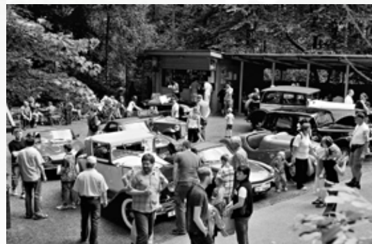
Veteráni v areálu Bozkovských jeskyní (2009)

S velkým počtem návštěvníků na jeskyních se však objevil nový problém. Za špatného počasí nanášeli návštěvníci bláto a jehličí nejen