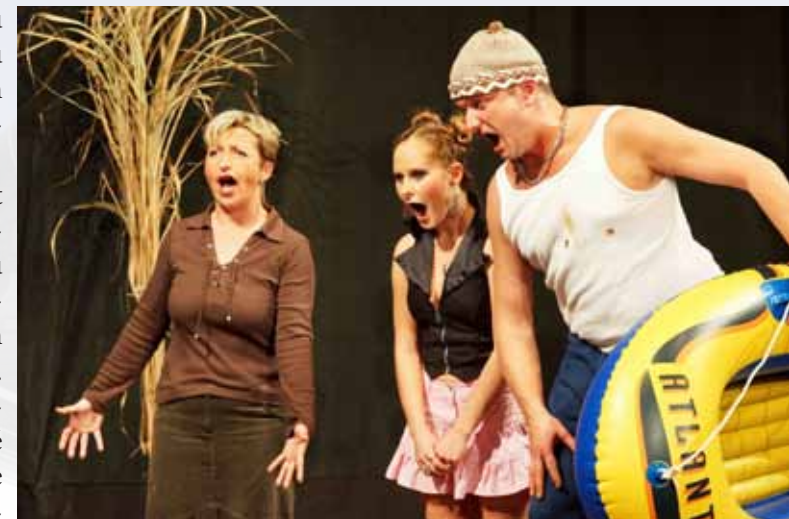
Dědeček aneb musíme tam všichni (premiéra prosinec 2012)

malu jsme se dostali až po naše, divadelními přehlídkami „ostřílené harcovníky“. Ne, opravdu jsem se nespletl, naši divadelníci se každoročně zúčastňují Přehlídky venkovských divadelních souborů „Josefodolské