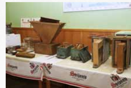
Z včelařské výstavky

Na vysvětlení, proč zde najdete článek o včelařích, jež má spolek v Jesenném. Je to proto, že u včelařů ve spolku je několik Bozkováků, které bych nerad připravil o členství v tomto přírodně důležitém oboru.