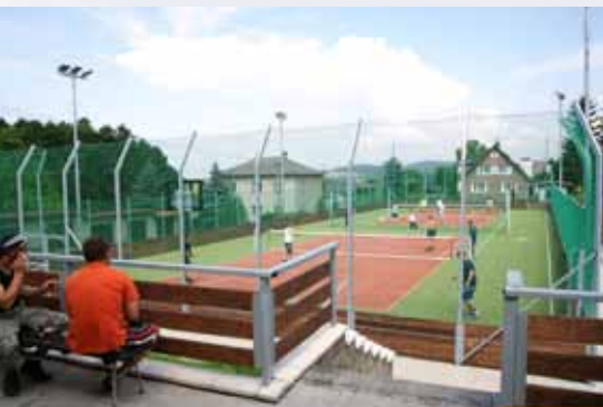
Nové tenisové a volejbalové kurty

poli sportovním: Několikrát týdně se schází ke cvičení naše dívky a ženy. Tato šikovná děvčata občas nacvičí i nějaký zajímavý tanec, se kterým vždy sklídí úspěch. Cvičí také školní děti, které si dvakrát do roka připraví sportovní výstup pro kulturní program v sokolovně.