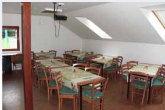
Interiér společenské místnosti kabin

Velmi populární a nejvíce početně zastoupené jsou tři fotbalové jedenáctky. Nejmenší družstvo žáků zdárně bojuje v okresním přeboru žáků. Běčko je perspektivní tým v okresní soutěži mužů a „staří mazáci“ z Áčka by jistě rádi postoupili