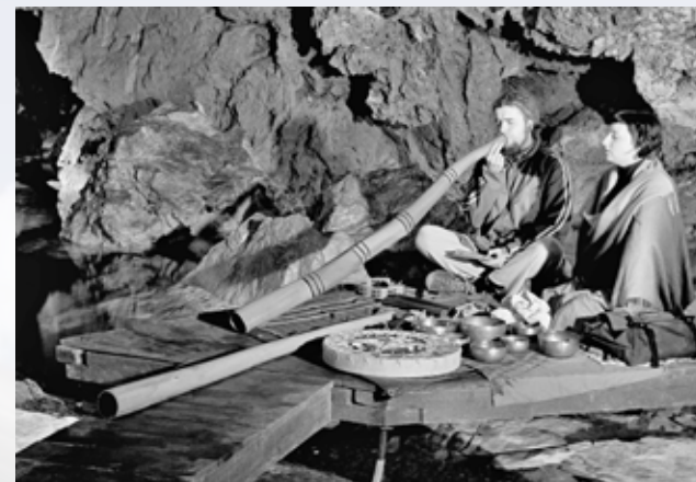
Netradiční vystoupení hráčů na didgeridoo v Jezerním dómu

Tady bych se chtěl omluvit čtenářům za poněkud suchopárné a prag-