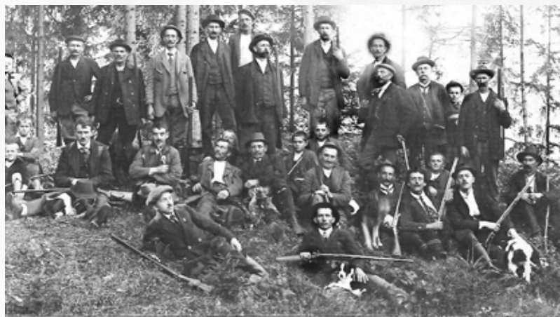
Myslivecká společnost /asi 1925/

je založena Československá myslivecká jednota, která slučovala řadu tehdejších spolků. Zároveň přišla změna s příchodem nových zákonů, jako třeba tzv. malý honební zákon, který upravoval doby lovu a hájení. Nastává II. světová válka a ta omezuje činnost myslivců. Teprve po roce 1948 dochází k „zlidovění“ myslivosti a tím je umožněn přístup do spolků