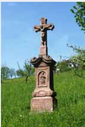
Obětím epidemie cholery

straně, hamr pak tam, kde je dnes pila Hudských. Vošmen-da, která ho poháněla, se ještě v roce 1542 jmenuje Potok Gockrušný, teprve s příchodem hutníků a hamerníků ze Štýrska se poněmčil na Waschemünde. Její voda ale také někdy přinesla záhubu. Tak se stalo i těm, kdo požívali její vody v roce 1832, kdy mnoho lidí v Dolením Příkrém a Podbozkově onemocnělo cholerou a 19 jich zemřelo.