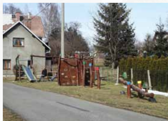
Dětské hřiště u sportovního areálu

Jinak dochází k průběžnému rozšiřování inženýrských sítí, to postupně, jak vznikají nové domky. Škoda, že obec nemá stavební parcely, stále