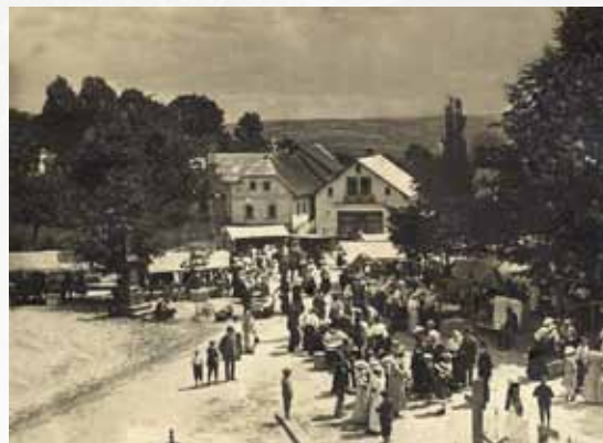
Historie bozkovských poutí (rok 1917)