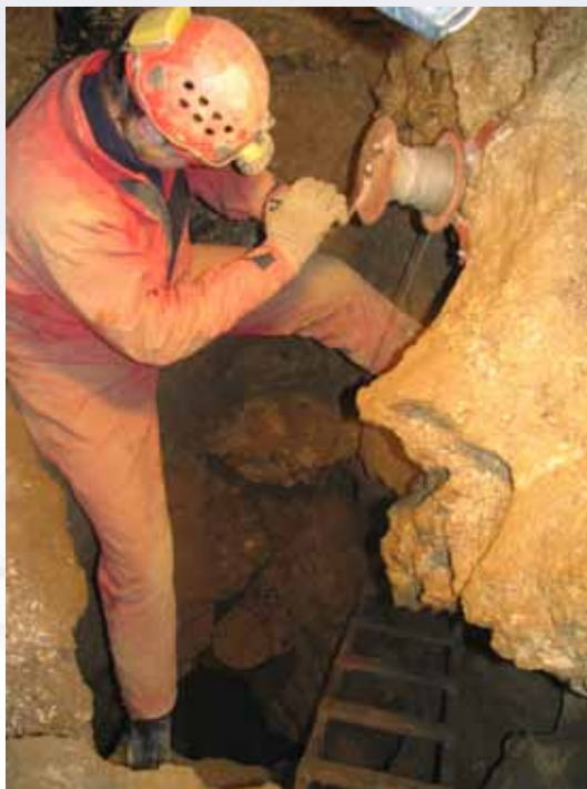
Páteční propast v Bozkově

Zatím nejrozsáhlejší objevy ale umožnily jen velmi nákladné a dlouhodobé čerpací pokusy v oblasti Jezerního dómu. První z nich probíhal od listopadu 1981 do dubna 1982. Za 95 dní vlastního čerpání byla snížena hladina o 8 m. Druhým čerpacím pokusem, na jaře 1996, byla snížena hladina vody v jeskyních dokonce o 14 m. Úspěšný byl průzkum Zadních Labutích jezer, kde byl objeven průlez do systému Novoroční jeskyně (cca 50 m), a po delším hledání v oblasti Mládežnického dómu byl 1. března 1982 v úrovni 8,50 m pod normální hladinou překonán sifon v Podvodních prostorách (75 m). V současné době je umožněn další průzkum Novoročních jeskyní díky