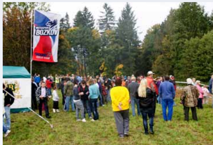
Diváčky atraktivní závody na motokrosové trati