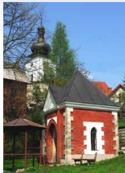
Kaple U Matičky po rekonstrukci