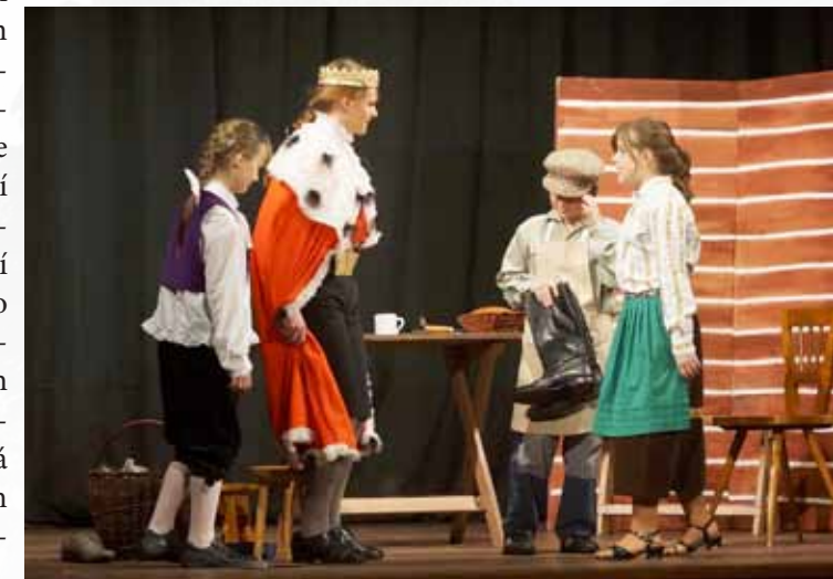
Děvčata zvládají zahrát krále i ševce ...

malu jsme se dostali až po naše, divadelními přehlídkami „ostřílené harcovníky“. Ne, opravdu jsem se nespletl, naši divadelníci se každoročně zúčastňují Přehlídky venkovských divadelních souborů „Josefodolské