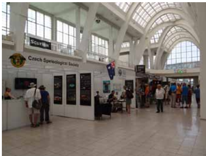
ČSS na Mezinárodním speleologickém kongresu v Brně