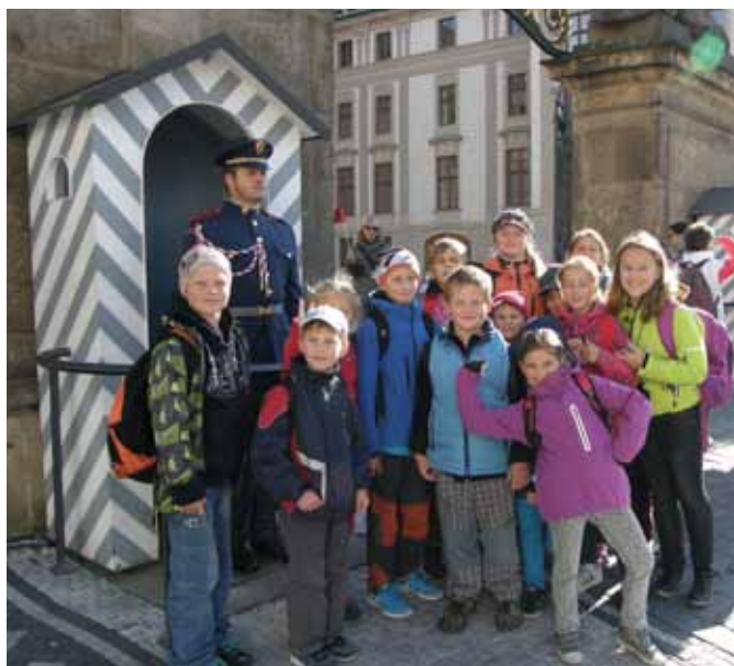
Výlet dětí do Prahy