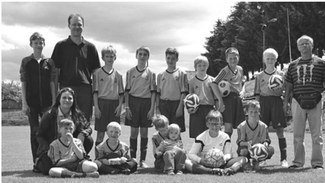
Starší přípravka s organizačním týmem.