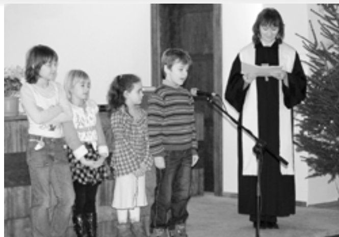
Z letošní Tříkrálové besídky

Sobota 22. 12. 18:00 hodin Jakub Ryba: ČESKÁ MŠE