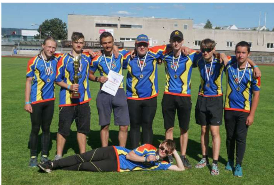
Dorostenci SDH Bozkov 2023

O to větší šok nás čekal na konci. Ve výsledkové listině svítíme na druhém místě a postupujeme na krajské kolo... Přiznám se, že s tím nikdo od nás nepočítal, prioritní disciplínou na vyšší kola je dorost a dospělí.