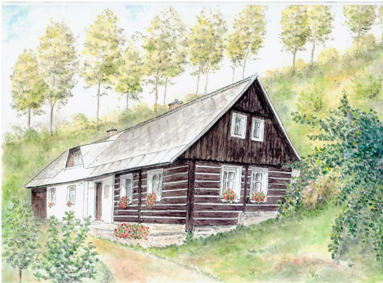
L. Nesvadbová chalupa čp. 98