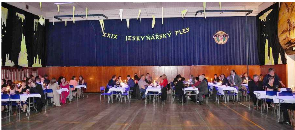
Po delší přestávce se letos uskutečnil tradiční 29. jeskyňářský ples

Za jeskyňáře s pozdravem Zdař Bůh Vratislav Ouhrabka