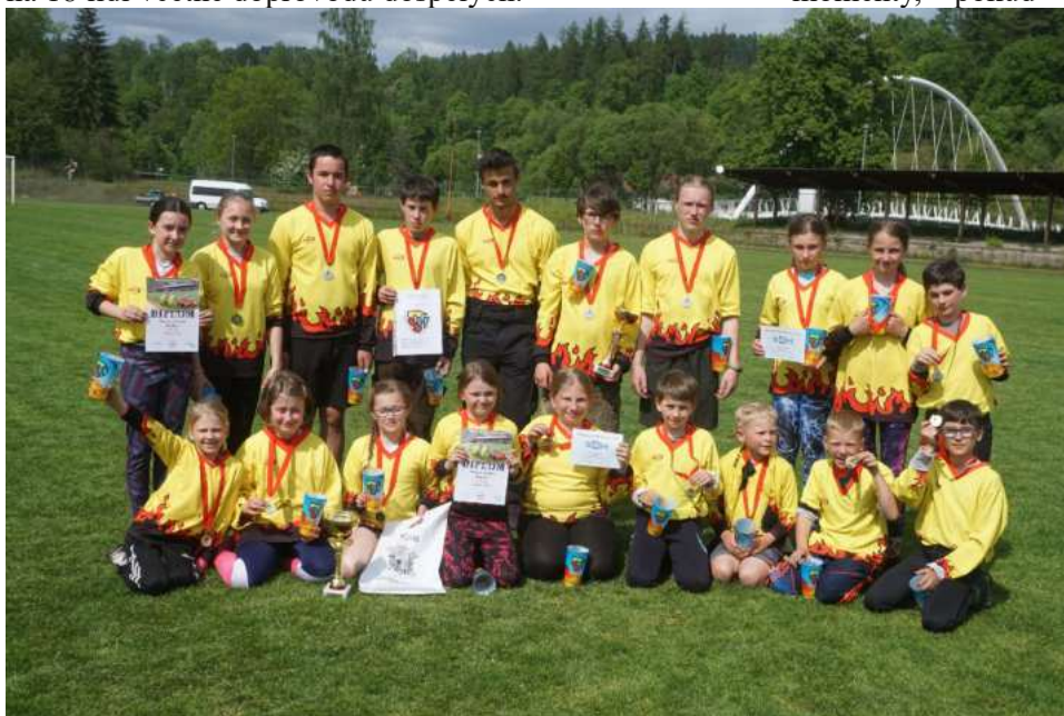
Děti SDH Bozkov po úspěšném okresním kole Plamen

Už od ledna jezdíme trénovat každý pátek večer do jablonecké haly, abychom se připravili na Český halový pohár v běhu na 60m, který měl zatím dvě části – proběhly soutěže v Jablonci nad Nisou a Ostravě. Soutěž v Jablonci jsme absolvovali v plné sestavě všech dětí, Ostravu jsme s ohledem na dopravu museli omezit na 18 lidí včetně doprovodu dospělých.