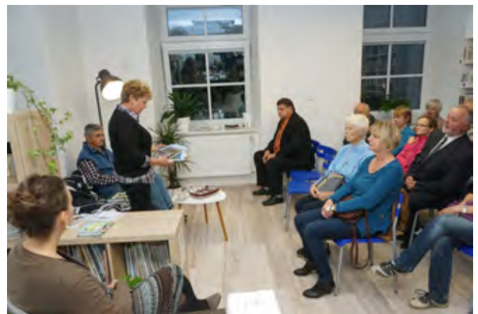
V prostorách knihovny se rozběhl seriál besed

Od ledna do srpna 2018 dojde z rodinných důvodů ke změně otevírací doby knihovny. A to na každou druhou středu v měsíci. Začneme tedy ve středu 10. 1., dále pak 24. 1., 7. 2., 21. 2. 2018 atd. Se začátkem nového školního roku 2018/2019 se otevírací doba opět upraví na stávající frekvenci. Poslední půjčovací den před Vánoci bude ve středu