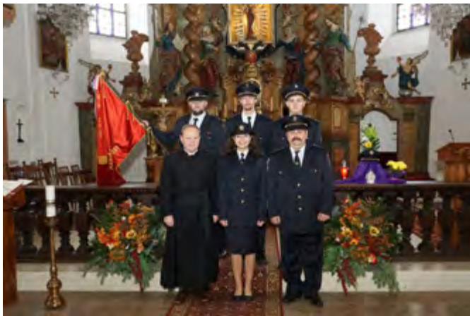
Tradiční vzpomínka na zesnulé hasiče v kostele

Družstva dospělých se letos věnovala hlavně postupovým soutěžím v požárním sportu a okresnímu poháru. Zde to dlouho vypadalo, že zvítězíme v obou kategoriích, nakonec se to ale povedlo jen ženám, muži se museli smířit s třetím místem, sezona byla dlouhá a určitý pokles formy se nám bohužel nevyhnul. Vše jsme si ale vynahradili v postupových soutěžích. Muži i ženy po úspěšném zvládnutí okrskového a okresního kola bojovali na krajském kole v Zákupcích o postup na mistrovství republiky, tentokrát se to povedlo pouze mužům. Ale i druhé místo žen na kraji je velmi dobrým výsledkem.