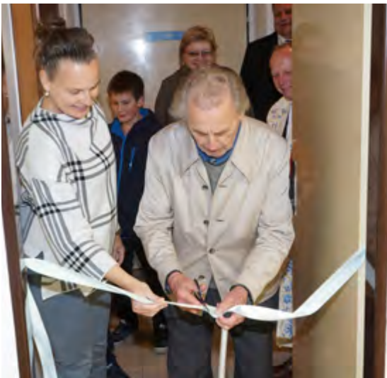
Slavnostní otevření zrekonstruované knihovny

Vážení čtenáři Bozkováčku, je mou milou povinností shrnout dění v naší knihovně od září tohoto roku. Slavnostní otevření Knihovny a vzdělávacího centra Bozkov proběhlo v pátek 17. září 2017. Pozvání na tuto slavnostní událost přijali pan starosta, pan farář a pan Hlava, který řekl pár slov o historii knihovny a zmínil o Bozkově v literárních dílech, zároveň přestříhl slavnostní pásku. Od středy 22. 9. byla knihovna otevřena pro veřejnost každý týden od 15.30 do 17.30. Zájemcům o knihy, které se nenachází v knižním fondu naší knihovny, vychází vstříc regionální oddělení semilské knihovny. Navázali jsme velmi dobrou spolupráci. Pevně věřím, že v ní budeme pokračovat i následující rok.