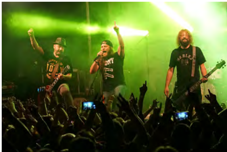
Sokol je i tradičním pořadatelem koncertů