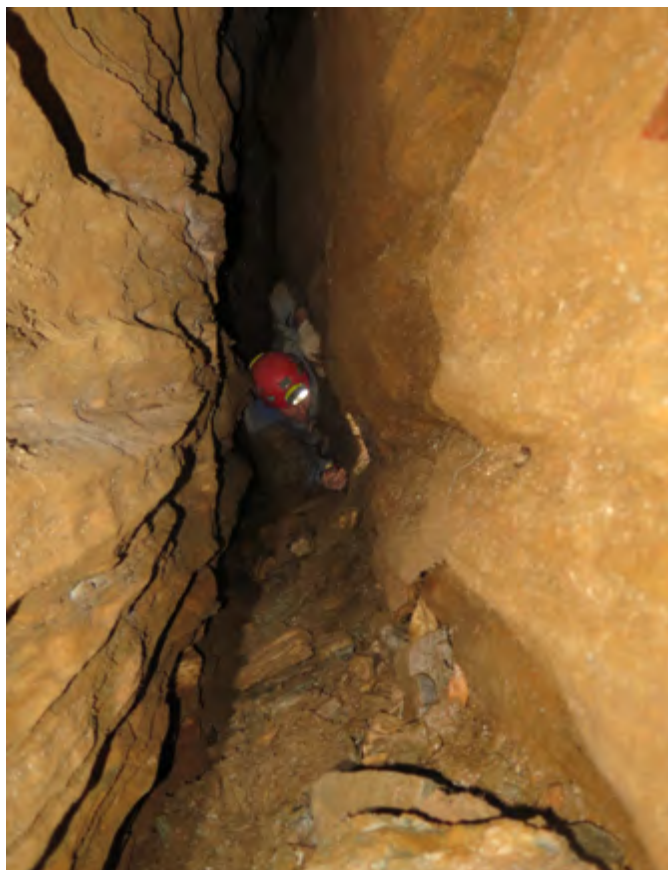
Těsné puklinové chodby jeskyně U Brádlérů