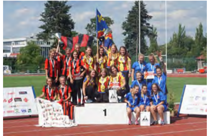
Mistryně republiky v požárním útoku

V kategorii dorostu nás letos reprezentoval tým dorostenek a stálo to opravdu za to. Holky ovládly okresní i krajské kolo, takže se po zásluze mohly radovat z již šesté účasti v řadě na mistrovství