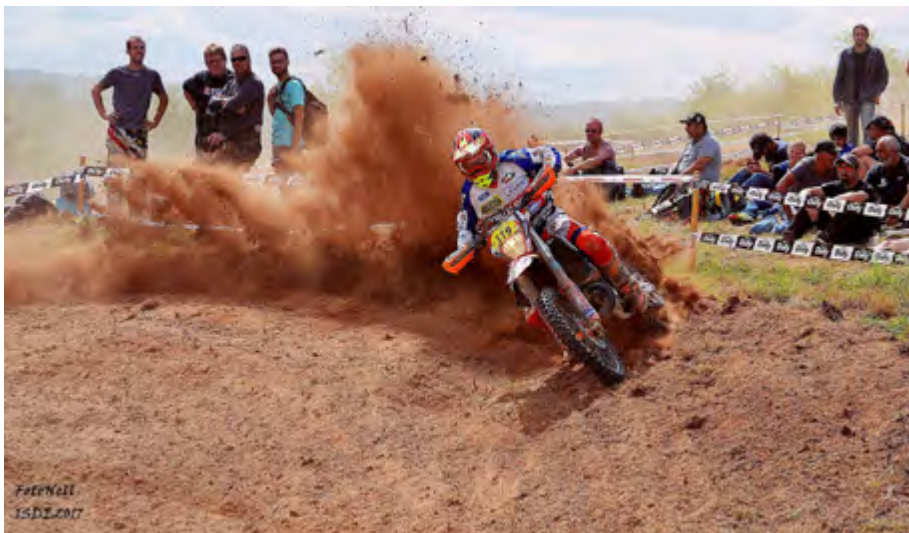
Motosport Bozkov reprezentuje na ISDE 2017 ve Francii

Vážení čtenáři, dovoluji Vám pomohli trochu zkrátit čekání na blížící se vánoční svátky, a to sdělením o naší činnosti za uplynulý půlrok. V tomto období byly pro nás nejdůležitější sportovní akce, kterých se Motosport Bozkov účastnil nebo figuroval jako pořadatel.