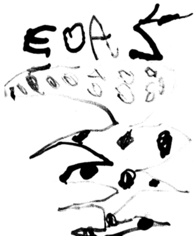
Žofinka Jodasová, 4 roky