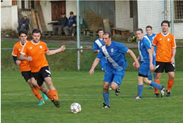
Zápas A týmu na Cihelném poli