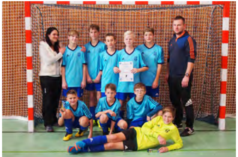
Družstvo mladších žáků na halovém turnaji v Železném Brodě

Letos v našem družstvu mladších žáků došlo k pár změnám. Spojili jsme se s družstvem ze Studence a k týmu přišel nový trenér Patrik Špidlen. Výsledkem je 3. místo v tabulce po podzimní části s jedním zápasem k dobru, který byl kvůli nepříznivému počasí přesunut do jarní části. K tomuto umístění jsme se dostali díky osmi výhrám a pouze dvěma prohrám, což značí veliký posun kupředu. V létě děti absolvovaly tradiční soustředění ještě pod vedením Zdeňka Částka, které letos trvalo šest dní. Děti si vyžádaly prodloužení termínu, což nás velice potěšilo, protože náš čas nad tím strávený nepřichází vniveč. Dále jsme se teď v listopadu zúčastnili halového turnaje v Železném Brodě, kde jsme se předvedli 4. místem. Ještě nás čeká jeden halový turnaj opět v Železném Brodě a jeden před začátkem jarní části.