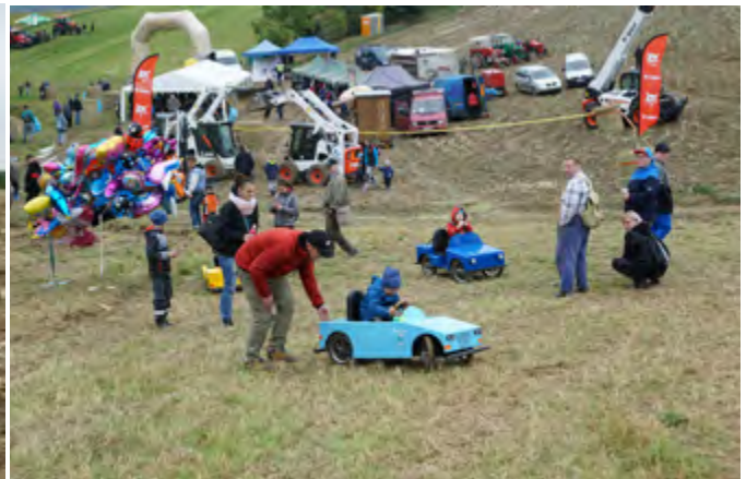
Traktory a malí traktoristé