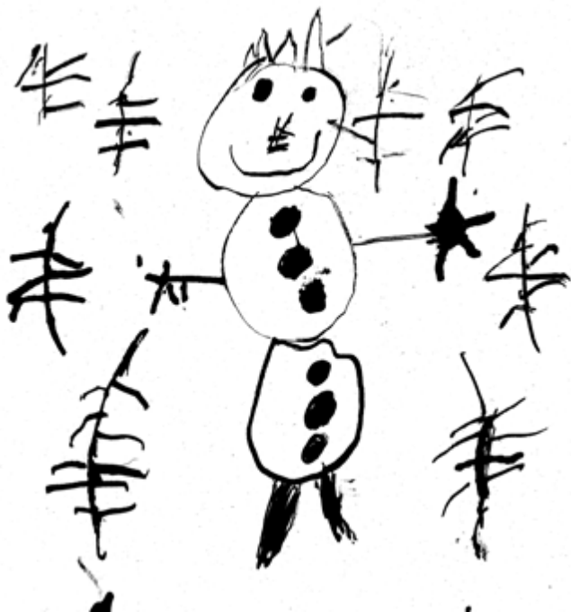
Natálka Ouhrabková, 5 let