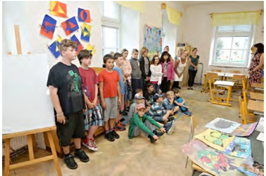
Školáci se představují hodnotící komisi Vesnice roku 2017