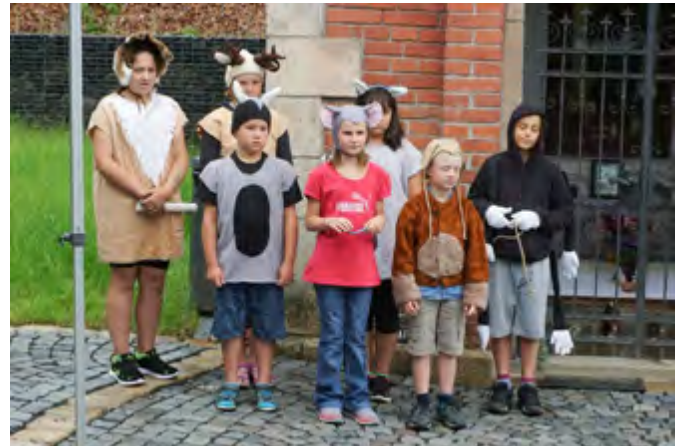
Mladí divadelníci se představují